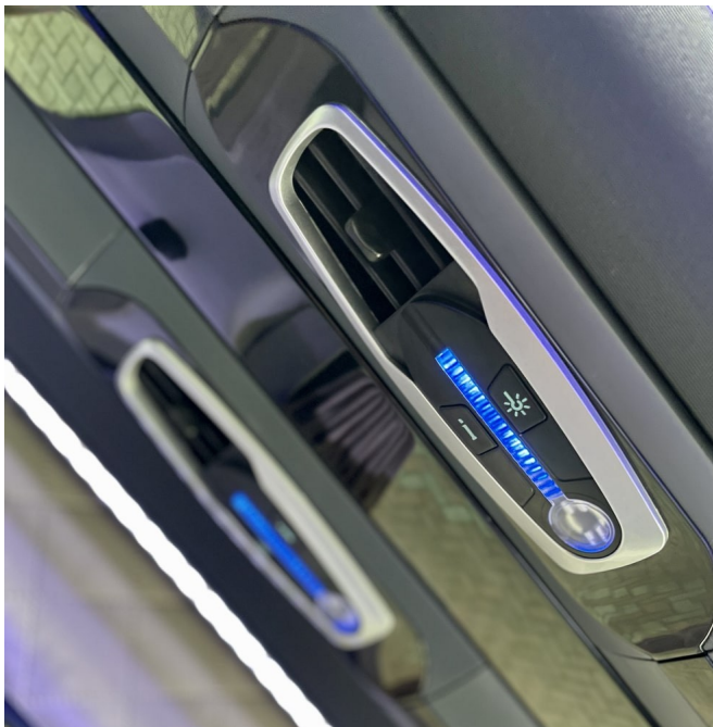
Archivo 1 - Panel - Relleno entre paneles