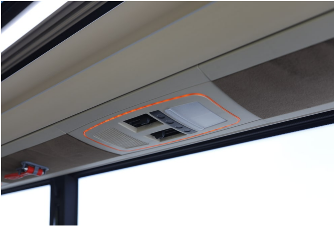
Załącznik 1 - Półki - Panele