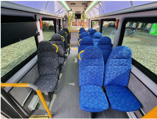
Anhang 2 - Sitze - Modell und Farbe