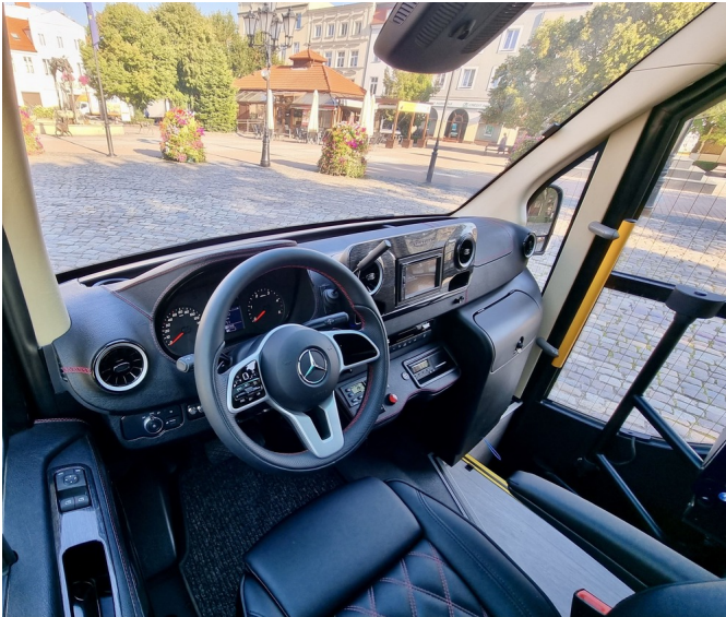
Bilaga 1 - Instrumentbräda - Inklädd