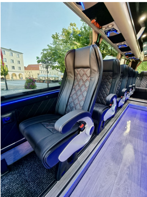
Bilaga 3 - Stolar - Modell och färger