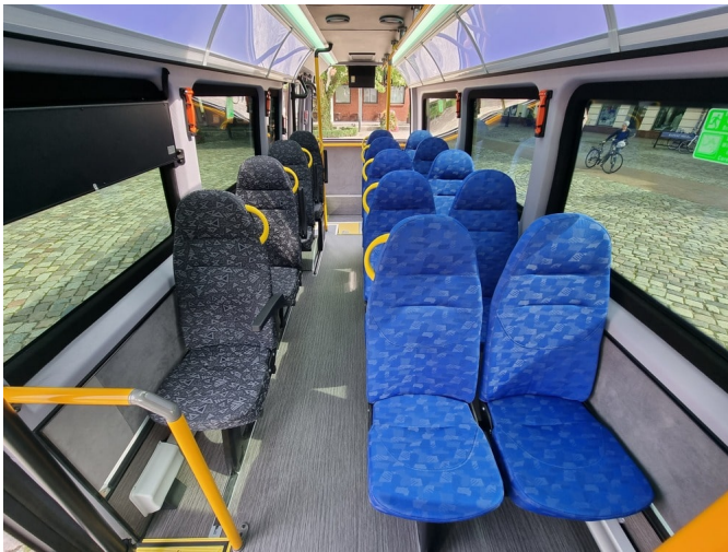
Bilaga 2 - Stolar - Modell och färger