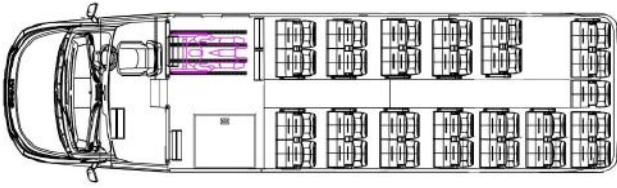
Bilaga 1 - Stolar - Placering av säten