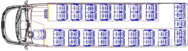
Bilaga 1 - Stolar - Placering av säten