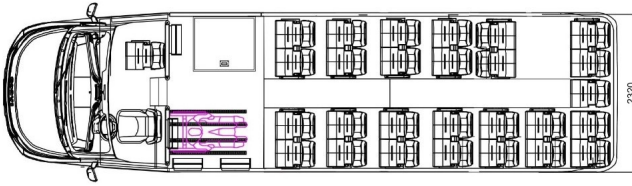
Bilaga 1 - Stolar - Placering av säten